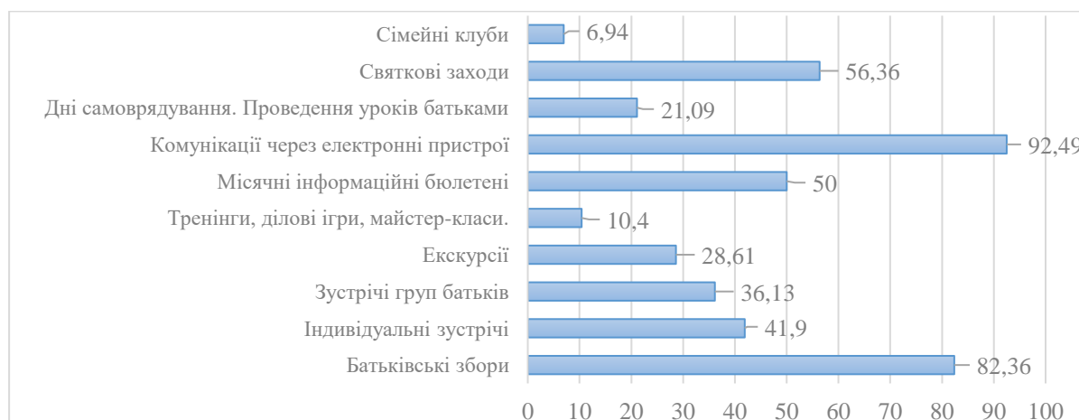
Рис. 3. Розподіл відповідей за ступенем ефективної взаємодії

Під час спостережень та онлайн анкетування нами було з'ясовано, які сучасні форми взаємодії та спілкування з батьками своїх вихованців найчастіше використовують учителі. Детальний аналіз результатів представлений у вигляді діаграми (див. рис. 3).