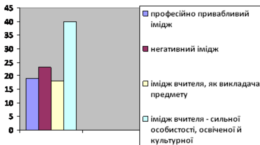
Рис. 1. Співвідношення різних типів іміджу професії вчителя сформованих у груповій свідомості сучасних школярів

Співвідношення різних типів іміджу професії вчителя, сформованих у груповій свідомості школярів, представлено на рис. 1.