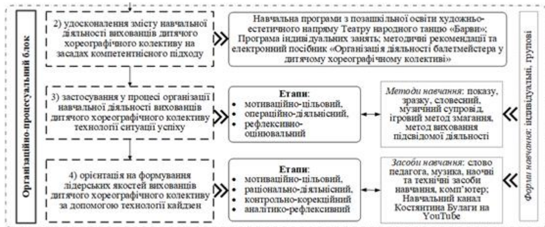
Рис. 2. Модель організаційно-процесуального блоку

Цей блок ґрунтується на технології ситуації успіху (мотиваційно-цільовий, операційно-діяльнісний, рефлексивно-оцінювальний етапи) та кайдзен технології (мотиваційно-цільовий, раціонально-діяльнісний, контроль-корекційний та аналітико-рефлексивний етапи), яка зорієнтована на формування лідерських якостей вихованців дитячого хореографічного колективу.