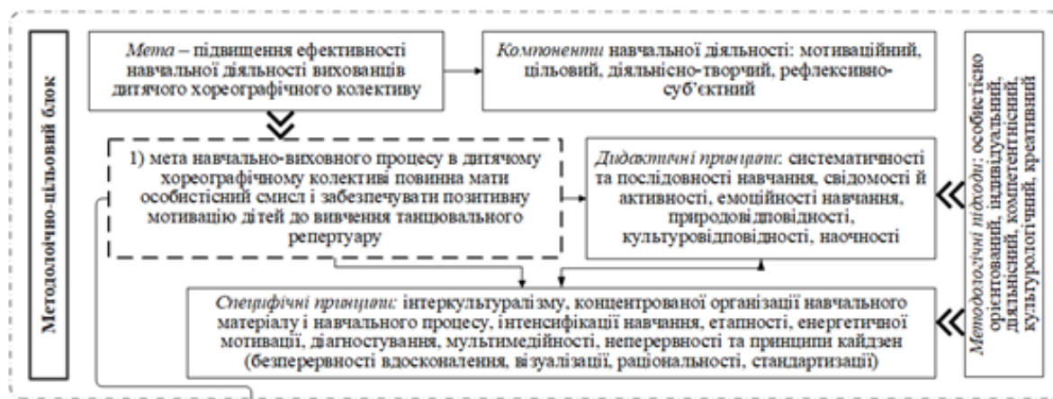
Рис. 1. Модель методо-цільового блоку

Організаційно-процесуальний блок моделі відбиває процес реалізації інших дидактичних умов, форми (індивідуальні, групові), методи (показу, зразку, словесний, музичний супровід, ігровий метод змагання, виховання підсвідомої діяльності) та засоби (слово педагога, музика, наочні та технічні засоби навчання, комп'ютер, навчальний канал Костянтина Булаги на YouTube) навчання вихованців мистецтву танцю.