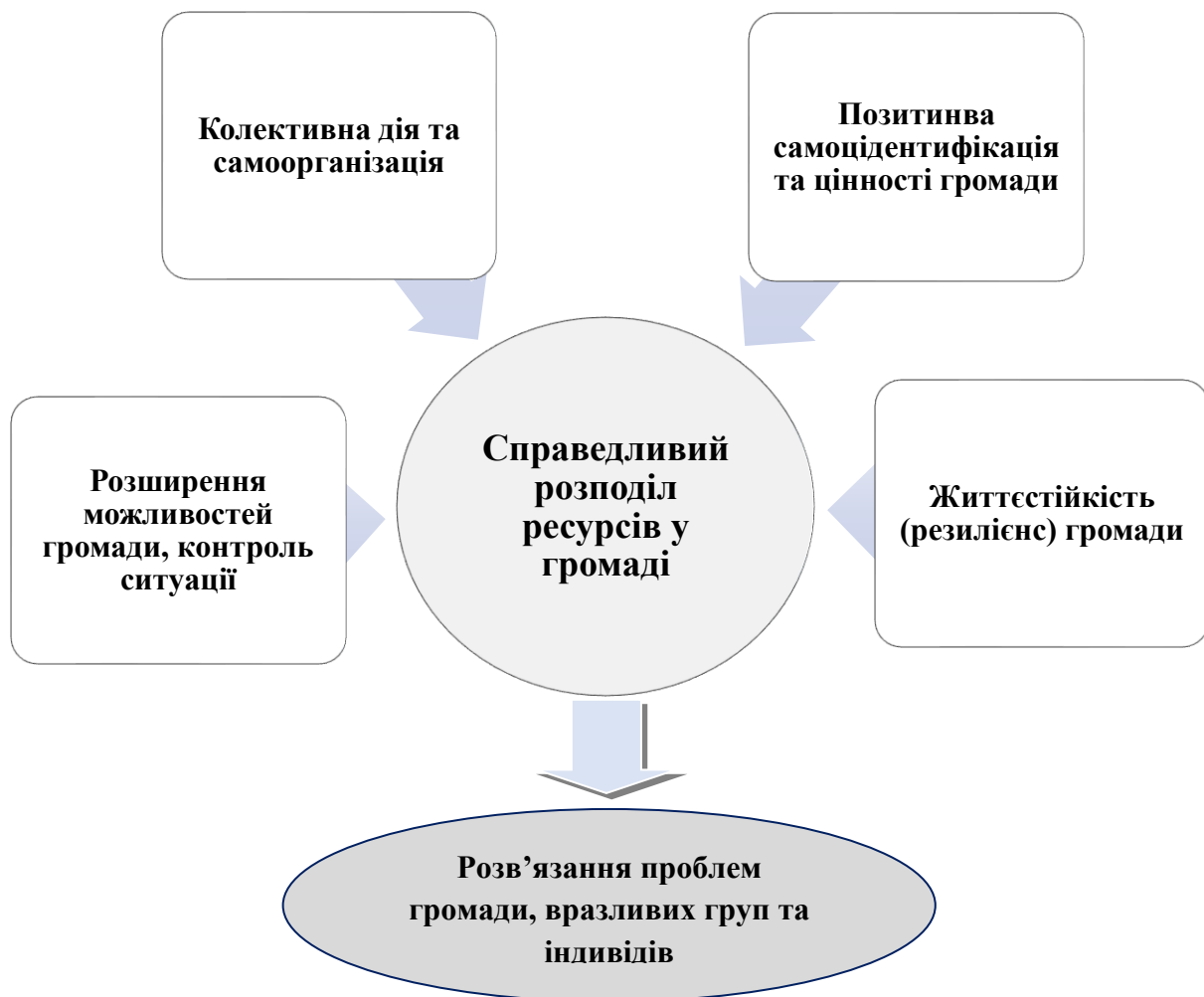
Рис. 2. Складові підходу, орієнтованого на сильні сторони, при його використанні в роботі з територіальною громадою

На рис. 2 представлено ключові складові підходу, орієнтованого на сильні сторони, при його використанні в роботі з територіальною громадою.