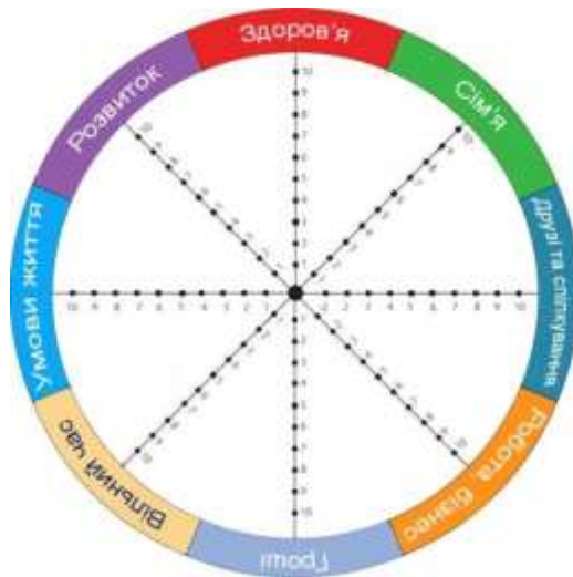
Рис. 1. Колесо життєвого балансу [2].

Клієнтам пропонується оцінити рівень задоволення життям у конкретній сфері за десятибальною шкалою, поставивши відмітку на малюнку. Наступним кроком є з'єднання відміток (оцінок) однією лінією.