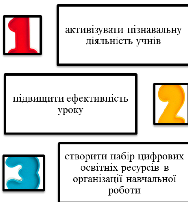
Схема 2. Основні завдання, які допомагають вирішувати віртуальні екскурсії на уроках географії

Віртуальна екскурсія допомагає вирішити такі завдання (схема 2):