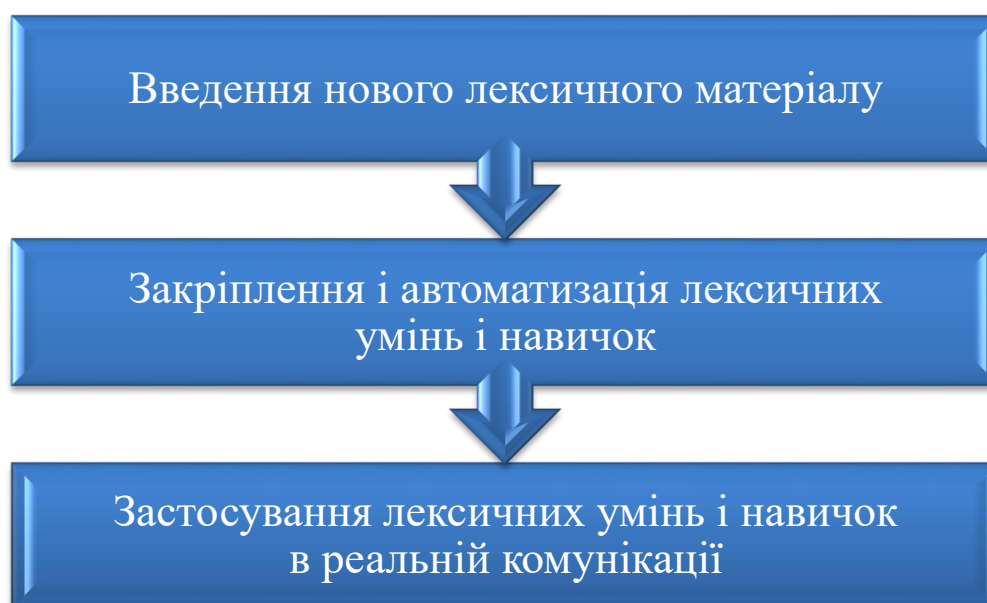
Рис. 2. Етапи формування фахової лексичної компетентності

Ми виділили три групи вправ (мовні вправи, умовно-мовленнєві вправи, мовленнєві вправи), з огляду на дослідження П. Я. Гальперіна про три етапи формування лексичних навичок: введення нового лексичного матеріалу; закріплення і автоматизація лексичних умінь і навичок; застосування лексичних умінь і навичок в реальній комунікації (рис. 2).