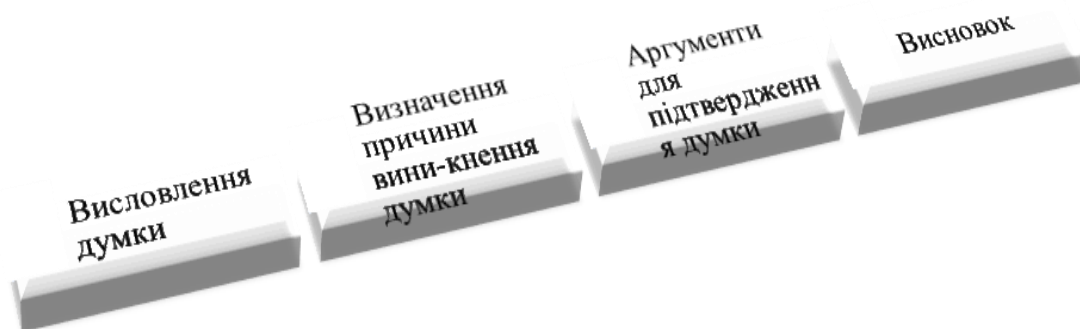
Рис. 3. Етапи реалізації методу «Прес»

Як свідчить рис. 3, на першому етапі використання методу «Прес» студентам пропонуємо висловити свою думку, пояснити власну точку зору. Уже на другому етапі обов'язковим є пояснення причини виникнення цієї думки, обґрунтування доказів. Третій етап має на меті доведення власної думки через подання прикладів, додаткових аргументів на підтримку власної позиції, а також фактів, які демонструють запропоновані докази. І четвертий етап передбачає узагальнення власних думок й формулювання висновків.