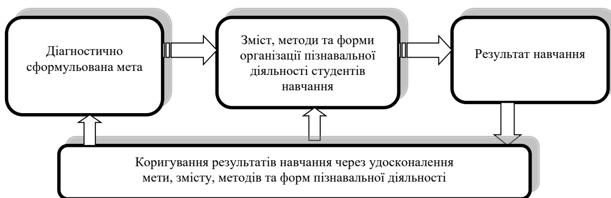
Рис. 1. Технологічне конструювання освітнього процесу вивчення англійської мови

У перекладі з грецької «технологія» – це сукупність способів переробки матеріалів, виготовлення виробів і процеси, що супроводжують ці види робіт [6, с. 6]. Технологічний підхід до вивчення англійської мови, як вказує Р. Гришкова, передбачає: чітку постановку викладачем цілей, їх уточнення з орієнтацією на досягнення результатів; підготовку навчальних матеріалів та організацію навчання відповідно до визначених цілей; оцінювання результатів, корекцію навчання, підсумкову оцінку результатів. Взнявши за основу ідеї Р. Гришкової, пропонуємо схему технологічного конструювання процесу вивчення англійської мови [5] (рис. 1).