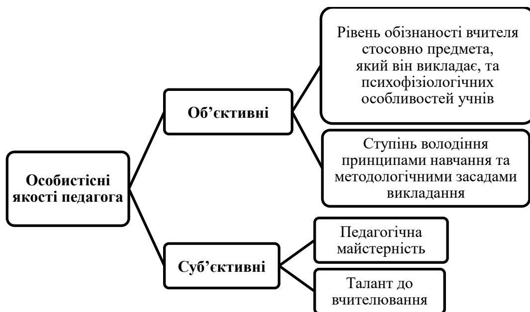
Рис. 2. Особистісні якості педагога (за П. Каптеревим) (узагальнено авторами на основі джерела [9])

Розглядаючи сутність професійної компетентності педагога, академік П. Каптерев, евристичний вектор наукового пошуку становила саме ця дослідницька проблема, запропонував виокремити такі особистісні якості вчителів: об'єктивні, суб'єктивні [4, с. 56–57]. Як видно з рис. 2, об'єктивні особистісні якості вчителя репрезентовані рівнем його обізнаності та ступенем володіння принципами навчання, методологічними засадами викладання [4]. До суб'єктивних якостей учений відносить педагогічну майстерність учителя, талант до здійснення педагогічної діяльності [4].