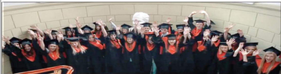
Уманські студенти готові випробувати себе у професійному зростанні

Менеджер проєкту «Інформаційна підтримка мереж ЄС в Україні» Денис Черпаків, ректор університету імені Павла Тичини Олександр Безлюдний, заступник міністра молоді та спорту України Марина Попатенко, Уманська міська голова Ірина Плетнюкова підписували ЄС за важливу підтримку української молоді та освітніх закладів.