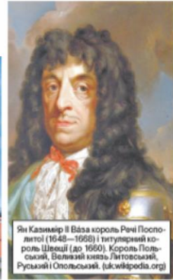
Ян Казимір II Ваза король Речі Посполитої (1648—1668) і титулярний король Швеції (до 1660). Король Польський, Великий князь Литовський, Руський і Опольський. (uk.wikipedia.org)

шей. За часів Російської імперії Умань стала центром військових поселень Київської та Подільської губерній, що означало домінування військової влади над цивільною і обмеження міського самоврядування. Весь штат ратуші складався з десяти осіб, двох із яких — ратманів, обирали окремо, від християнської та єврейської громад. Юдеї так само були представлені в Совісному суді, який проводив свої засідання в ратуші. З 1861 р. ратушу було реорганізовано в міську думу, яка і залишалась в будинку до початку ХХ ст.