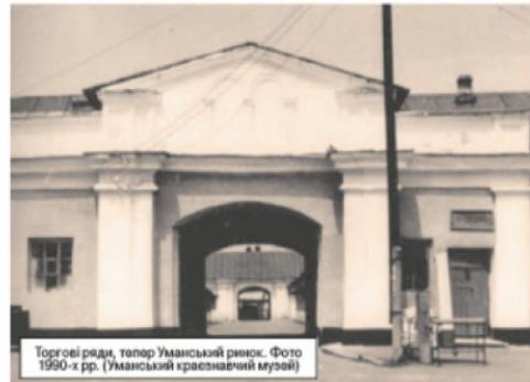
Торгові ряди, тепер Уманський ринок. Фото 1990-х рр.

Міська реформа 1870 р. розширила повноваження думи. Міський голова став важливою персоною в питаннях благоустрою міста та його мешканців. Володимир Долбін та Софроній Логвинський перебували на цій посаді на початку ХХ ст., і саме завдяки їхнім зусиллям відбувалась динамічна забудова Умані. Центр міста заповнювався модерними будинками. Проживання в цій частині міста стало питанням престижу. В цей час центр міського самоврядування змінив місце. На одній з нових вулиць — Садовій, 1912 р. з'явився прибутковий будинок. Архітектором його став одесьит Юрій Дмитренко. Новий будинок перейняв повноваження від ратуші. Уманці знали його як «міський будинок». Замовником будівлі стала міська дума. А те, що побудовано його було на кошти акціонерного товариства домовласників, можна сприймати за новий ступінь у самоорганізації місцевої громади. Нетривалий час тут пе-