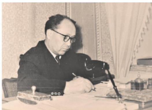
Український науково-дослідницький інститут землеробства в Києві. За 1957-1976 рр., під керівництвом та науко-