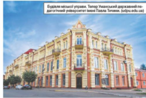
Будівля міської управи. Тепер Уманський державний педагогічний університет імені Павла Тичини.

Весь час ратуша співіснувала з торговими рядами — десятками крамниць, щоденне функціонування яких відображало багатокультурний ландшафт міста, тобто присутність польської, єврейської, української, вірменської та російської спільнот. Торгові ряди в ратуші були зоною економічного та інформаційного контакту між містом та селом. Сучасники з певною недовірою ставились до появи нових торговельних операцій та їхніх виконавців — маклерів, сприймаючи їх за відвертих крадіїв, які тільки і мріють позбавити довірливих містян останніх гро-