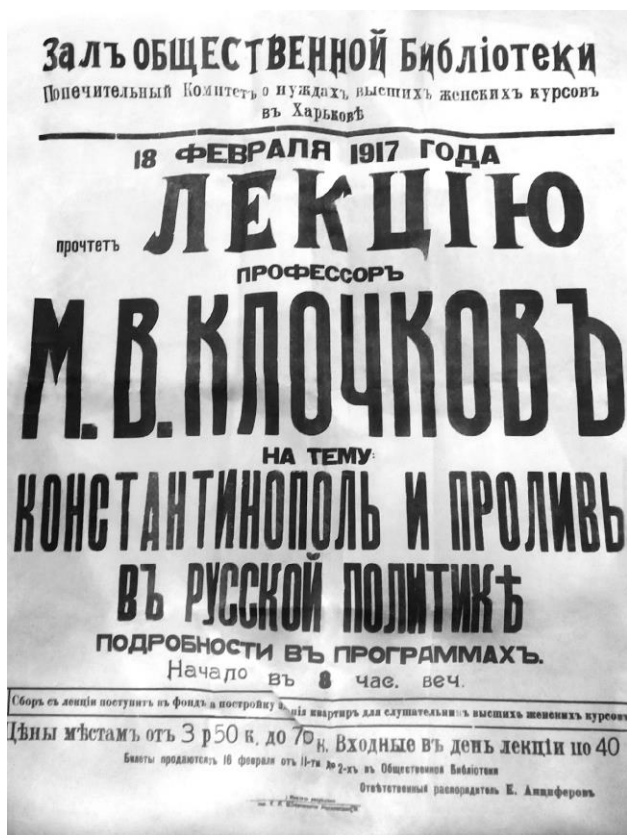
Архівний документ. Афіша лекції М. В. Ключкова «Константинополь і протоки в російській політиці»

(у юридичному корпусі університету) «Великий Новгород. Його соціальний побут та народо-владдя» [20, арк. 2]. Зазначена лекція була організована Харківським міським народним університетом.