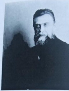
Володимир Павлович Науменко (1852–1919)

ПОСТАТЬ ВОЛОДИМИРА НАУМЕНКА (1852–1919) У ЗБЕРЕЖЕННІ КУЛЬТУРНО-ІСТОРИЧНОЇ ІДЕНТИЧНОСТІ УКРАЇНСЬКОГО НАРОДУ