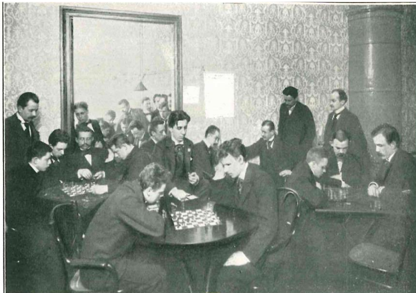
Комната для ігор.

У вихідні та святкові дні молодь із захопленням займалась у спеціально відведених кімнатах грою в шашки, шахи та доміно. «Попит на місця за гральними столами часом буває таким великим, що багатьом доводиться попередньо встановлювати свою чергу, або задовольнятися роллю простих глядачів при грі» [3, с. 35]. Гра в карти та на гроші, театральні вистави, а також танцювальні вечори суворо заборонялись.