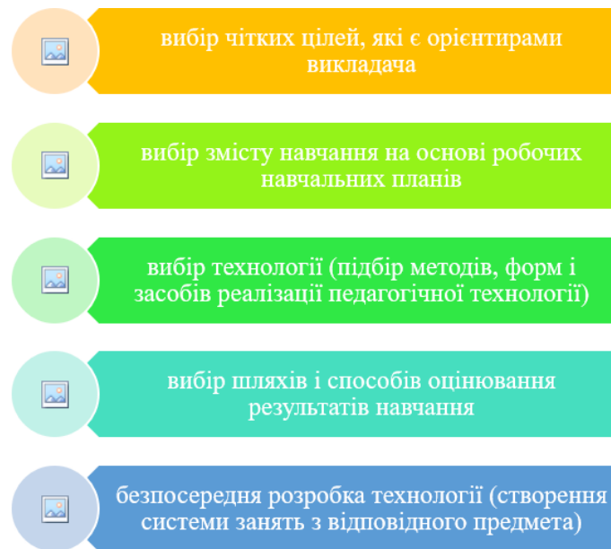
Рис. 2. Алгоритм розробки технології навчання

Характерні риси організації інтерактивного навчання полягають у заохоченні учнів до самостійного пошуку та дослідницької активності, глибокому осмисленні навчального матеріалу, розвитку креативності та творчого мислення, обговоренні стратегії навчальної діяльності щодо відповідної теми, оцінюванні досягнень разом зі своїми однолітками та вчителем. Основною перевагою інтерактивного навчання є створення більш широкого спектру можливостей для індивідуального розвитку особистості та реалізації її потенціалу, сприяння формуванню пізнавальної активності та самоосвітньої діяльності. Іншими словами, учень має можливість обирати спосіб засвоєння матеріалу, темп виконання завдань та свою роль у навчальному процесі.