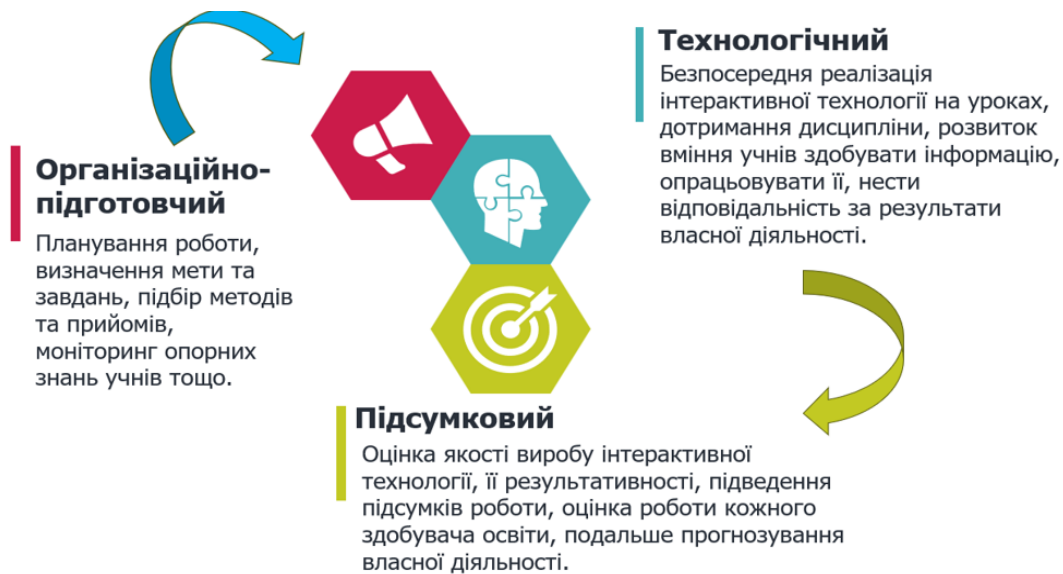
Рис. 5. Етапи застосування інтерактивних технологій

Розглянемо приклад застосування інтерактивних технологій на уроці біології і екології в 10 класі (рис. 6).