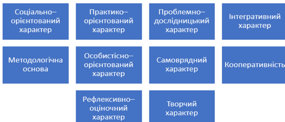
Рис. 3. Характерні можливості інтерактивних технологій навчання в процесі реалізації особистісно-орієнтованого навчання

Отже, на засадах зазначеного, можна змоделювати характерні можливості інтерактивних технологій навчання в процесі реалізації особистісно-орієнтованого навчання на уроках біології і екології у 10 класі (рис. 3).