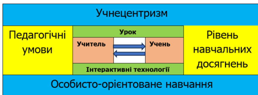
Рис. 4. Функціональна модель формування успішного учня в навчанні

Отже, на засадах зазначеного, ми визначили оптимальні педагогічні умови застосування інтерактивних технологій для реалізації особистісно-орієнтованого навчання на уроках біології і екології в 10 класі та розробили функціональну модель формування успішного учня в навчанні (рис. 4).