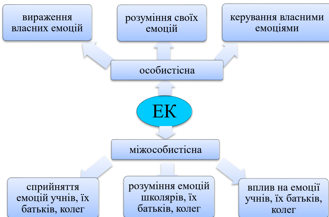
Рис. 1. Зміст емоційної компетентності майбутнього вчителя початкової школи

Особистісний компонент. Вираження власних емоцій: здатність адекватно виявляти і виражати власний емоційний стан за допомогою міміки обличчя, жестів, інтонаційної виразності мовлення, сили і висоти голосу. Оволодіння майбутнім учителем початкової школи широким спектром вербальних (логічний наголос, смислова пауза, емоційне забарвлення голосу, виразність, чіткість мовлення) і невербальних інструментів (жести, міміка, пантоміміка, погляд) допоможе яскраво виражати свої емоції, почуття, що буде сприяти емоційному викладу навчального матеріалу, кращому розумінню учнями.