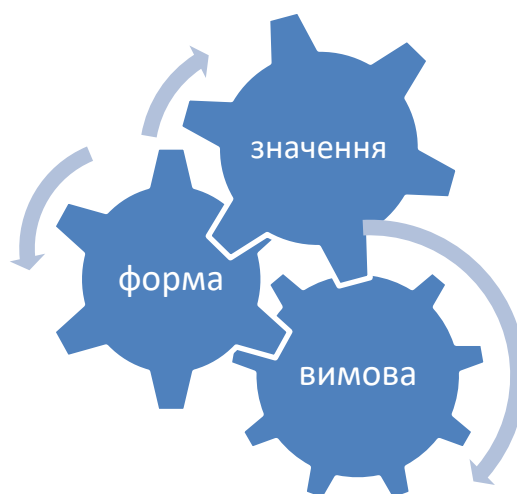
Рис. 3 Структура типу уроку MFP

Структура MFP типу уроку іноземної мови складається теж з трьох етапів. Meaning – етап пояснення значення слова, виразу чи граматичної структури шляхом використання їх у контексті. Form передає усі можливі трансформації та можливості для вживання мовної одиниці її зв'язок з іншими лексемами, колокація. Pronunciation передбачає фокусування на фонології, звуках, інтонації, наголосі, тощо (див. рис. 3).