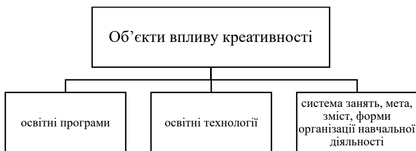
Рис. 2. Об'єкти впливу креативності на освітній процес

Ми будемо розглядати креативність як глибинну властивість особистості, її здібність створювати оригінальні цінності, приймати нестандартні рішення, виходити за межі відомого, виявляти творчість у різновидах діяльності. Як складне особистісне утворення вона об'єднує в собі такі характеристики як інтуїція, фантазія, видумка, оригінальність, ініціативність, самоорганізація й працьовитість. Ці показники креативності позитивно впливають на продуктивність професійної підготовки майбутніх педагогів, коли вони знаходять насагу не стільки в досягненні цілі, скільки в самому процесі педагогічної творчості. Креативність як інструментальний ресурс педагогічного дизайну впливає на ефективність усіх ланок професійної підготовки (рис. 2).