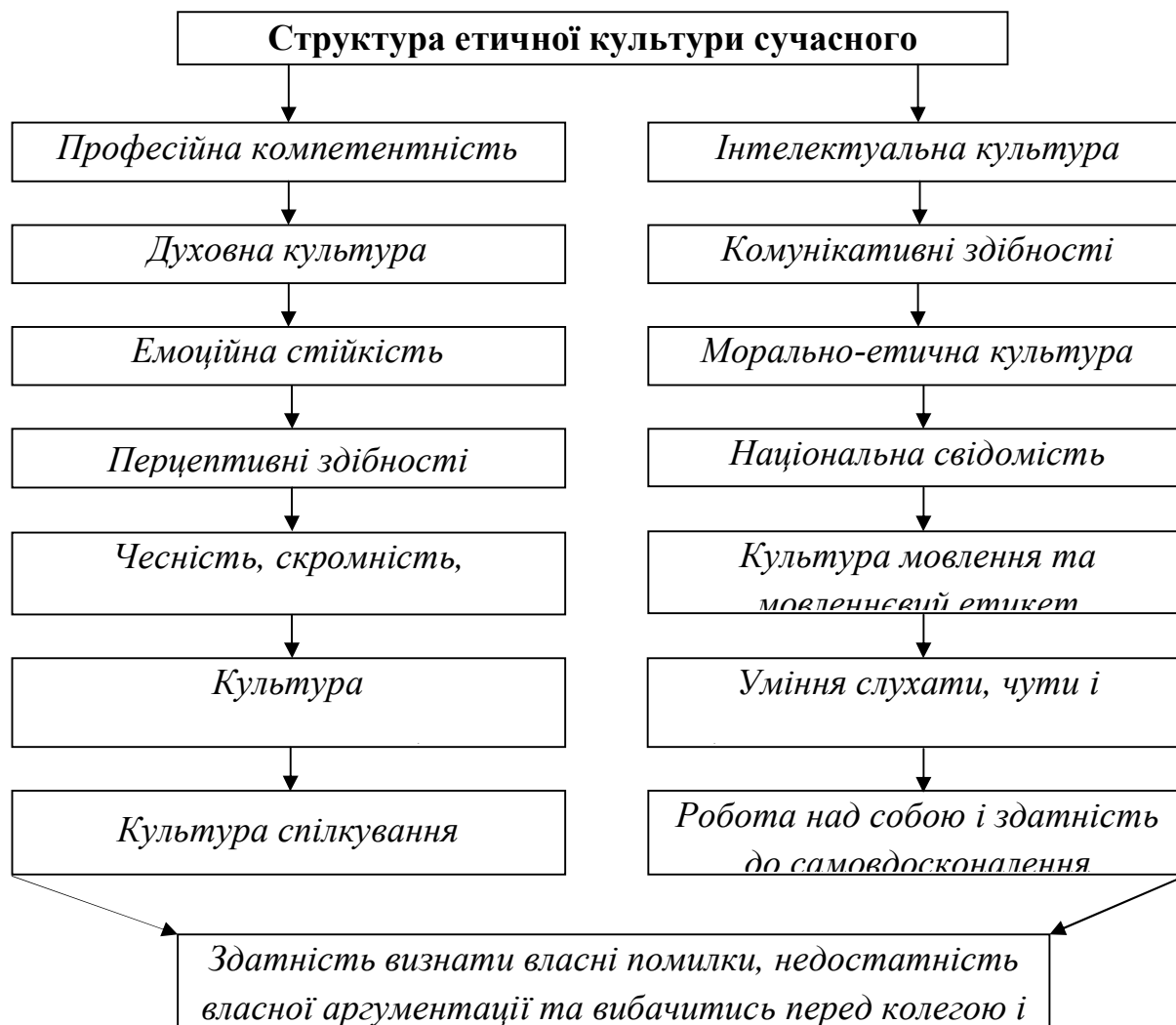
Рис. 2. Структура етичної культури сучасного вчителя

Як ми бачимо, етична культура є складним інтегративним утворенням, що базується на такій важливій якості, як самокритичності, здатності визнавати власні помилки, готовності до суб'єкт-суб'єктної взаємодії з батьками та школярами.