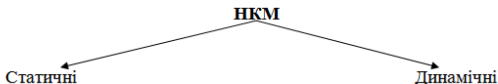
Рис. 2. Класифікація НКМ за наявністю динаміки

типи навчальних комп'ютерних моделей можна піддати такій класифікації. Статичними або динамічними можуть бути і цифрові, текстові і змішані моделі. Прикладом статичних цифрових моделей можуть бути таблиці, а динамічних – цифрові дані, що змінюються з часом. В якості статичної текстової моделі може виступати текстовий опис зміни параметрів моделі. Прикладом динамічної текстової моделі можуть бути повідомлення про зміну параметрів моделі, що з'являються на екрані (рис. 2).