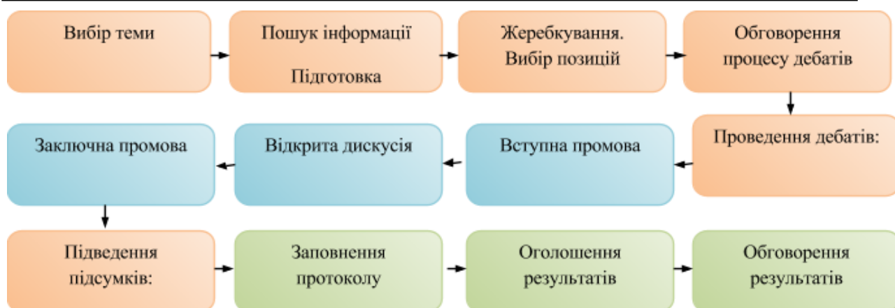
Рис.2. Етапи дебатів