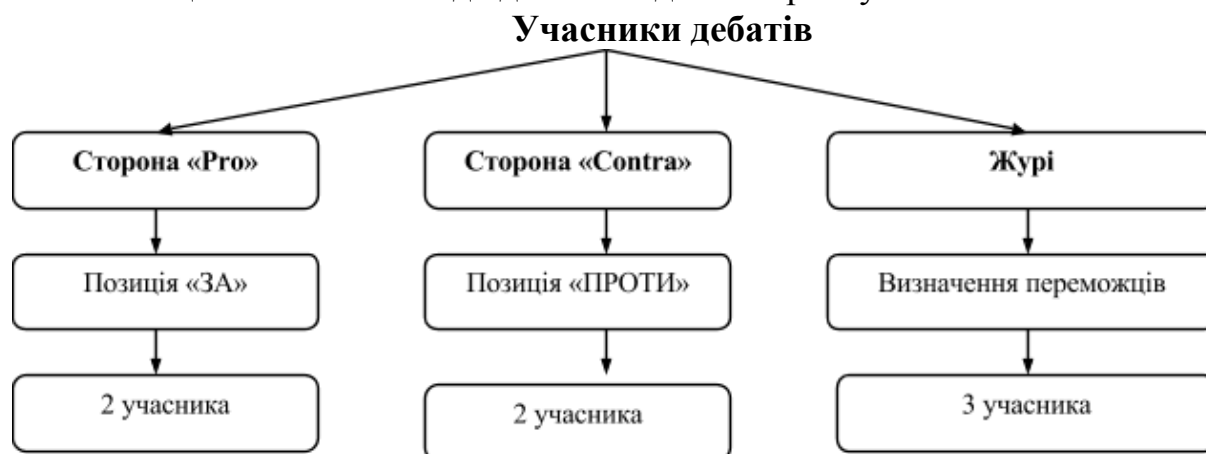
Рис.1. Учасники дебатів

Участь у дебатах беруть чотири особи: двоє представляють позицію «PRO» («за») і двоє – позицію CONTRA («проти») (рис. 1). Усі четверо заздалегідь готують і аргументи «за», і аргументи «проти», дізнаючись про свою позицію за 30 хвилин до дебатів під час жеребкування.