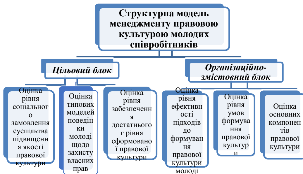
Рис. 7. Структурна модель менеджменту правової культури молодих співробітників

практичного навчання, навчально-методичного забезпечення та впровадження авторських спецкурсів; діяльності ініціативних груп та гуртків; оцінку інтегрованої структури правової культури; набуття власного досвіду застосування правових норм; оцінку основних компонентів формування правової культури молоді (цільового, змістовного, оперативно-діяльнісного, стимуляційно-мотиваційного, морально-правового виховання, контрольно-регулятивного), що представлено у рис. 7).