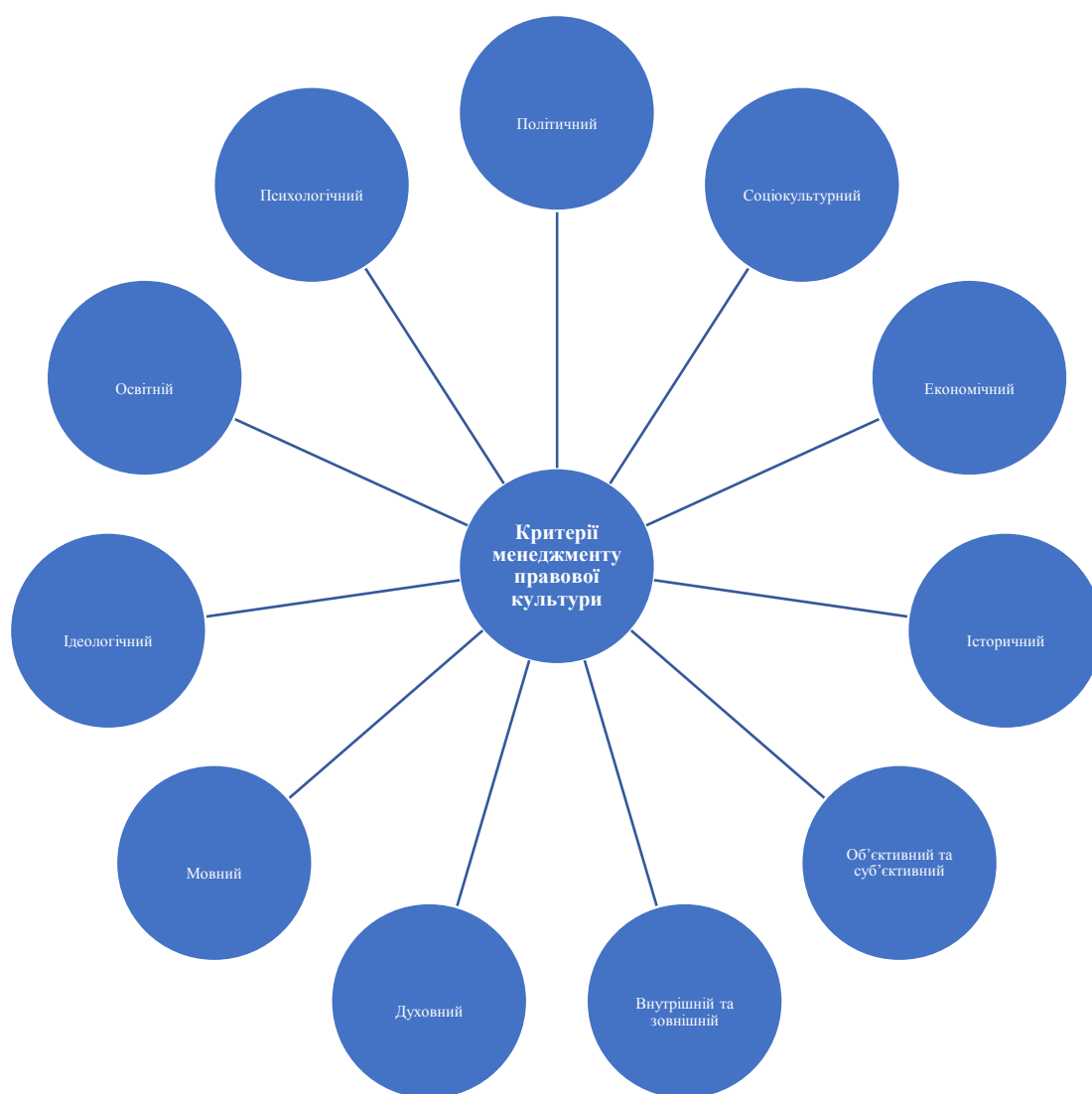
Рис. 3. Критерії оцінки правової культури

Як видно з рисунку 3, критерії оцінки правової культури молоді включають в себе політичні, економічні, соціокультурні, об'єктивні, суб'єктивні, історичні, мовні, духовні, освітньо-виховні, ідеологічні, особистісно-психологічні та інші індикатори.