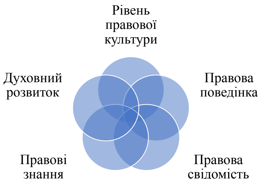
Рис. 5. Компоненти правової культури

До соціальних впливів на правову культуру молоді, які мають вирішальне значення, належить рівень розвитку і функціонування економіки, якість життя населення та його ставлення до суспільних перетворень; діяльність усіх органів влади, засобів масової інформації та їх вплив на свідомість, волю, поведінку і переконання громадян; досвід населення, його ставлення до культури, традицій, звичок, побуту, соціальних відносин тощо; професіоналізм професорсько-викладацького складу, рівень його педагогічної майстерності та педагогічної культури, можливість здійснення регульовального впливу на процес правової культури молодих співробітників. Компоненти правової культури, які реалізують ці соціальні впливи, представлено на рисунку 5.