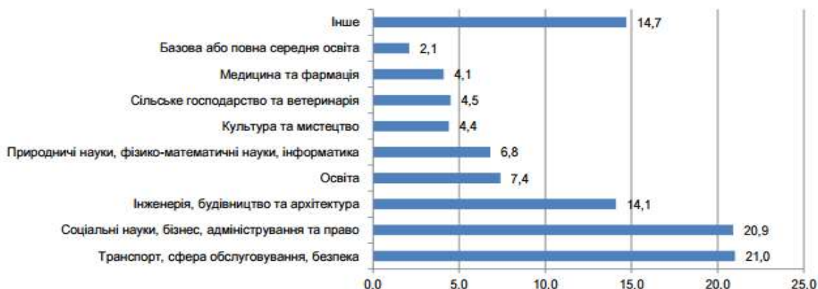
Рис. 1. Структура неформально зайнятої молоді за напрямками здобутої освіти [6].

Статистичний аналіз [4] ствердує, що освіта молоді не відповідає умовам ринку. Простіше кажучи, попиту на професії, які отримують нинішні випускники, нема. Близько 70 % молоді отримують вищу освіту, більшість гуманітарну. У результаті 45 % юристів – безробітні, а знайти майстра по ремонту побутової техніки не так легко. Крім того, багато професій зникають через появу високих технологій. У перспективі вже за 10 років значно скоротиться попит на перекладачів, бухгалтерів, юристів, автоматизовано буде посади адміністраторів, менеджерів. Через 20 років зникне потреба у водіях та пілотах. Дослідження проведене силами School-to-work transition surveys [6], показало, що є істотна залежність між вибором професії та ризиками працевлаштування до неформального сектору (рис. 1).