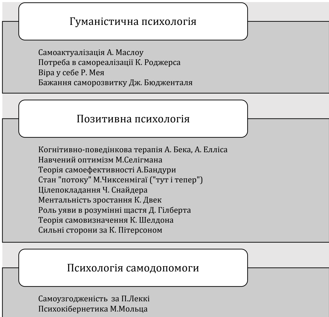
Рис. 1. Теоретичне підґрунтя підходу, орієнтованого на сильні сторони клієнтів у соціальній роботі.

роботи з клієнтом, при плануванні структурованих інтервенцій, спрямованих на трансформацію самооцінки і формування нових поведінкових патернів.