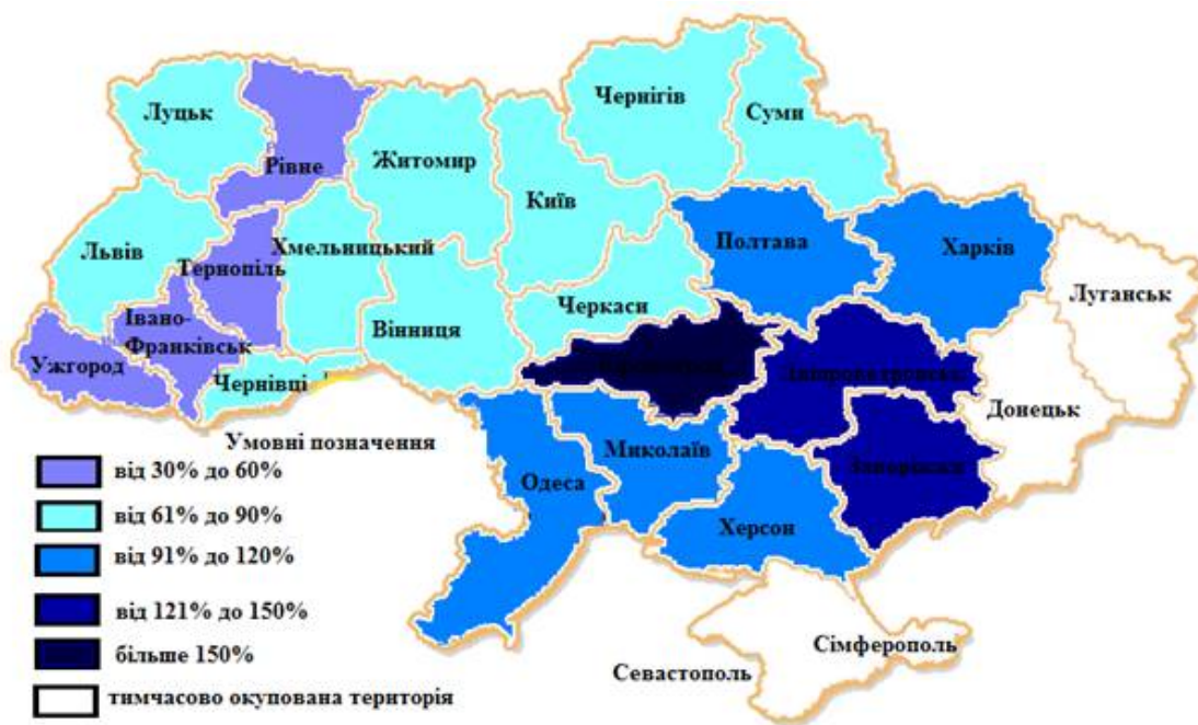
Рис. 1. Кількість зареєстрованих злочинів на 1000 осіб, 2014 р.

За інформацією МВС України у Кіровоградській області кількість зареєстрованих злочинів з 2001 до 2014 року зросла на 71,4 %. Отже, кримінальний фактор залишається одним з головних чинників, що впливає на стан соціально-демографічної, національної безпеки (Рис. 2.).