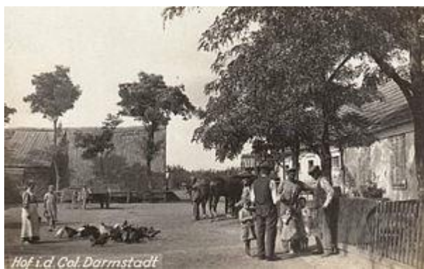
Таврійські німці. Колонія Дармштадт