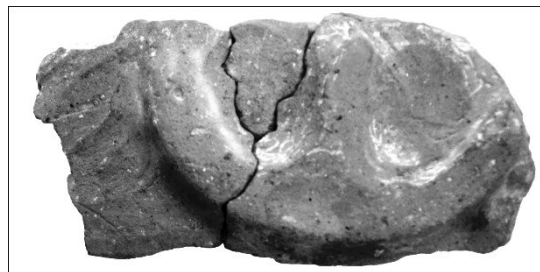
Мал. 2. Знак трисутності (фрагмент стінки горщика)

Фактично цей символ відсутній в орнаментальних композиціях розписного посуду західного варіанту Трипілья. Проте він зустрічається на ритуальному посуді східного локального варіанту. Яскравим підтвердженням цього є знахідка фрагментів великої ритуальної посудини, знайденої під час глибокої оранки на трипільському поселенні в урочищі «Долинка», що знаходиться на південно-східній околиці міста Христинівка Черкаської області. Поселення входило до складу пеніжківсько-щербанівської локальної групи, однією з характерних ознак якої є наявність посуду з заглибленим орнаментом. Приблизні розміри посудини із знаком трисутності такі: висота – 60 см, діаметр горловини – 45 см. Традиційний трипільський орнамент – «сварга» нанесено трипільським майстром за допомогою пальців рук. Проте зображення знака трисутності є випуклим (наліпним), висота зображення – 1, 2 см [мал. 2].