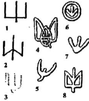
Мал. 3. Знаки тризуба на Україні за князівської доби (VIII-XII ст. н.е.):

1, 2 – Причорномор'я; 3, 4 – Київщина; 5 – Чернігівщина; 6 – Вишгород; 7, 8 – Остерський Городець.