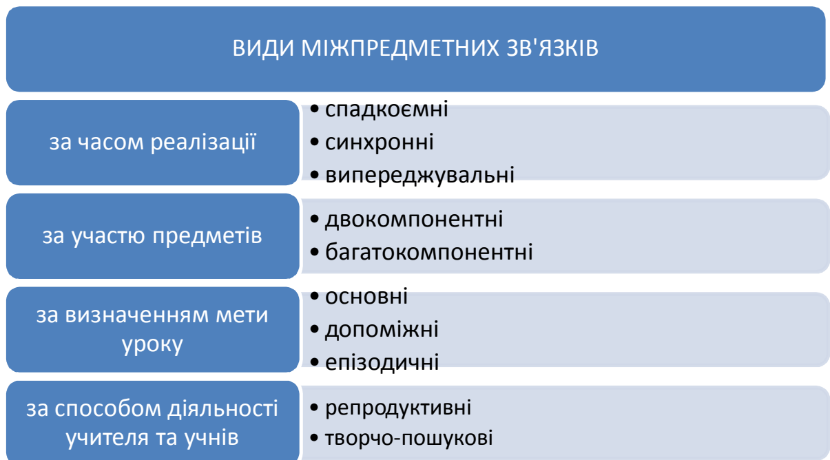
Рис. 2. Види міжпредметних зв'язків

Ми маємо власне бачення видів міжпредметних зв'язків: