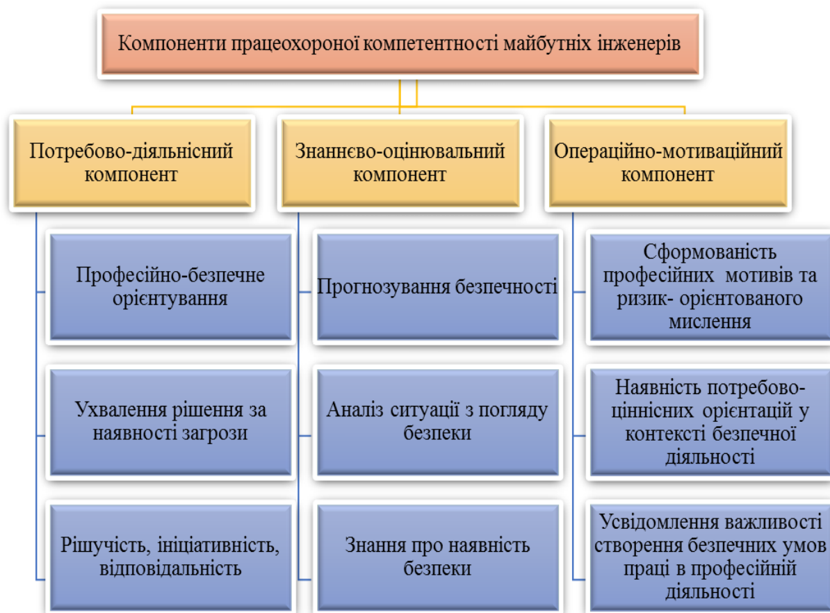
Рис. 2. Структура працезохороної компетентності майбутніх інженерів

Інтеграція сучасних підходів з особливостями, відображеними у вигляді структурно-логічної схеми, показаної на рис. 1, дає змогу скоригувати та спроектувати навчання з урахуванням студентоцентрованого підходу та індивідуальних особистісних якостей майбутнього фахівця працезохоронної галузі.