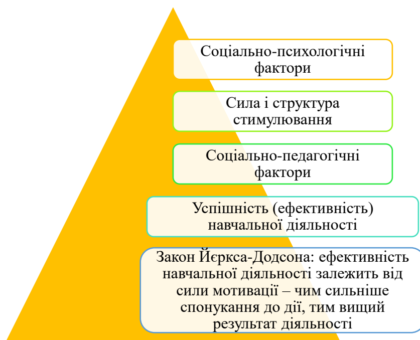
Рис. 3. Вплив стимулювання на успішність навчальної діяльності

Вагоме значення для формування компетентної особистості майбутнього фахівця має залучення його до продуктивної творчої діяльності, яка пов'язана з пізнавальною мотивацією й спрямована на оволодіння досвідом творчого пізнання майбутньої професії у процесі навчальної діяльності. Таким чином, підкреслюється продуктивний характер творчої діяльності і творчого мислення.