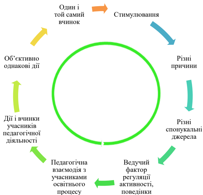
Рис. 2. Стимулювання як фактор регуляції дій і вчинків учасників освітнього процесу

Отже, стимулювання є провідним чинником, який регулює активність, поведінку і діяльність особистості. Будь-яка педагогічна взаємодія зі студентом стає ефективною лише за умови врахування деталей його мотивації. Можуть бути абсолютно різні причини, чому здобувачі діють однаково. При цьому джерела мотивації однієї дії можуть бути абсолютно різними (рис. 2).